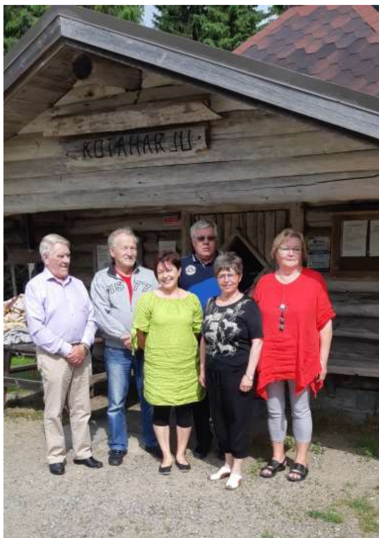
Tarkastuslautakunta Kotaharjulla v. 2019